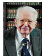
Nobelovac Ronald Coase